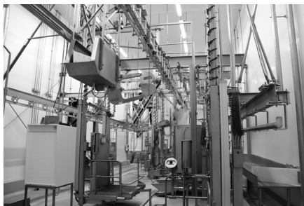
Interior de l'Escorxador Transfronterer, a Ur

Fet i fet, és habitual que al costat espanyol, quan cerques un treball de cara al públic, et demanin no només el domini del català i del castellà, sinó que també és important conèixer el francès. A l'altre costat de la frontera, passa una mica el mateix, si bé no