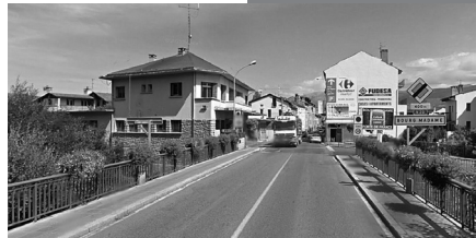
Pont internacional. Conurbació de Puigcerdà-Bourg-madame