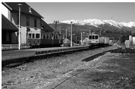
El petit tren groc recorre la major part dels pobles de l'alta Cerdanya

Un altre camp on pot haver-hi cooperació i desenvolupament transfronterer és l'esportiu, no tant en l'aspecte lúdic o competitiu, com en el sentit més purament econòmic. Font-romeu, per exemple, té unes instal·lacions molt conegudes d'alta muntanya. També la baixa Cerdanya podria oferir infraestructures d'alt rendiment esportiu, en un entorn d'altura, saludable i immillorable en molts aspectes per a la pràctica de molts esports, estades, etc.