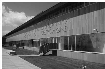
Vista exterior de l'Hospital Transfronterer, Puigcerdà