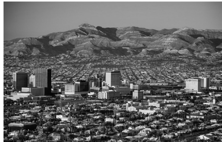
Ciutat d'El Paso, a la frontera entre els EUA i Mèxic