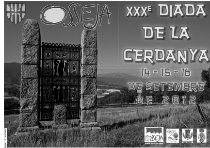
Cartell anunciador de la Diada de Cerdanya de l'any 2012

L'altre model és el tecnològic, que es dona a la frontera francosuïssa, amb instal·lacions com el CERN. És evident que Europa no ens construirà una infraestructura tan gran i costosa com el gran col·lisionador d'hadrons a la nostra vall, però s'hi poden instal·lar altres entitats molt més petites, lligades al món científic i universitari. A mig camí entre Tolosa i Barcelona, seria un lloc ideal per viure-hi, investigar i treballar.