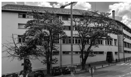
INS Pere Borrell, Puigcerdà